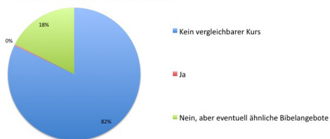
Grafik 2 aus Umfrage

Diese bestehenden Bibelangebote wurden genannt